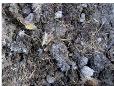
Bio - Hühnertrockenkot