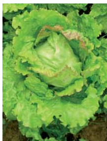
An der Salatsorte „Grazer Krauthäuptel“ wurden 8 Dünger getestet.

Die ausgewählten Dünger können mit ihrem jeweiligen Stickstoffgehalt der Tabelle 1 bzw. den Fotos auf der rechten Seite entnommen werden. Kürbiskernkuchen wurde in zwei Aufwandmengen eingesetzt, Biosol diente als Kontroll- bzw. Standard-Variante. Alle Varianten wurden nach einer Nmin-Analyse auf die nach den Richtlinien für sachgerechte Düngung im Garten- und Feldgemüsebau für Kopfsalat vorgegebene Stickstoffmenge von 100 kg/ha ausgebracht.